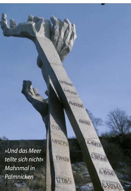
»Und das Meer teilte sich nicht« Mahnmal in Palmnicken

Mit einem fröhlichen Abschluss beschenkte uns ein Lehrer, den wir auf der Busfahrt nach Palmnicken kennengelernt hatten: In den Räumen der jüdischen Wohlfahrtsorganisation Chessed lehrte er uns israelische Tänze. Wir waren gegangen, um zu segnen, und wurden dabei selbst überreich beschenkt! Bei einem der Teilnehmer meldete sich im Nachhinein ein Mann, der als 12jähriger alles in Palmnicken miterlebt hatte. Betet für ihn, der Gott ablehnt. Mt.18,12-18