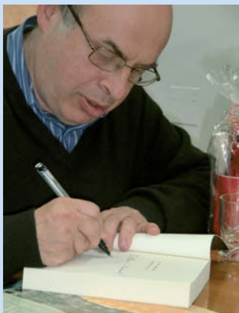
Jerusalem: Nathan Scharanski signiert sein Buch: Fear No Evil (Habe keine Angst vor dem Bösen).

Nathan Scharanski, geboren 1948 in Stalino/Donetsk, ehemaliger Dissident der UdSSR, ist seit 2009 Leiter der Jewish Agency For Israel in Jerusalem. (Diese halbstaatliche Organisation bringt Juden aus aller Welt nach Israel.) 1977- 86 als Dissident in Gefängnis und Gulag, ging er, den Psalm 30 betend, in die Freiheit. Er machte eine einzigartige Alijah, als er am 11.02.1986 auf der Glienicker Brücke zwischen Berlin und Potsdam gegen russische Spione „ausgetauscht“ wurde und dann seinen Weg ins Verheißene Land fortsetzen konnte. Glaube, Wahrhaftigkeit, Klugheit und mutiges Handeln kennzeichnen auch weiterhin Scharanskis persönlichen wie politischen Weg.